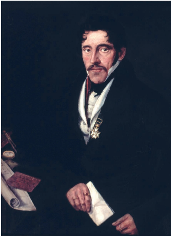
Abb. 2: Baron Wilhelm Ludwig von Eschwege, Gemälde aus dem Museu Paulista Universidad de Sao Paulo Brasilien, Inventar-Nummer 1-19410-0000-0000. Mit Zustimmung des Museums.

im Jahr 1822 von Eschwege in Weimar veröffentlichten Buch (siehe Kap. 2.2.) als auch in dem im Folgejahr 1823 von Alexander von Humboldt verfassten und in Paris erschienenem Essay 20 (Humboldt 1823) berücksichtigt wurden (Beck 1959a, S. 53). Beck konnte nicht nachweisen, ob Humboldt die Sammlungen Eschweges persönlich gesehen hatte.