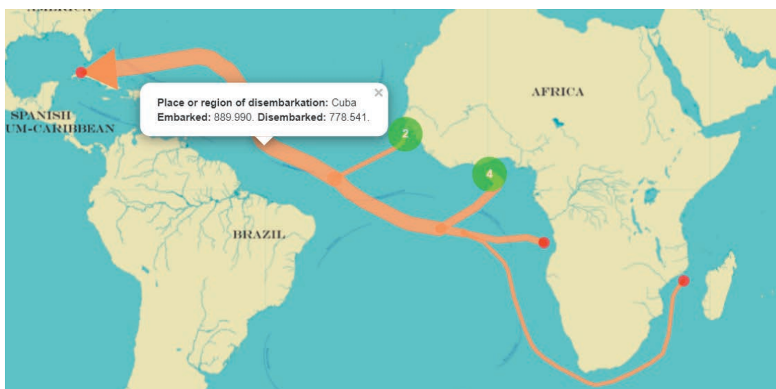
Abbildung 4: Karte des transatlantischen Sklavenhandels von den Küsten Afrikas nach Kuba 1501–1866, The Trans-Atlantic Slave Trade Database, http://www.slavevoyages.org/estimates/6WTUUIYk .

In den vier Jahrhunderten zwischen 1501 und 1866 wurden 889 990 Menschen nach Kuba verschleppt. Die Sklavenschiffe kamen aus Senegambia (Senegal/Gambia), Sierra Leone, der Windward Coast (Liberia/Elfenbeinküste), der Goldküste (Ghana), Benin, Biafra (Nigeria/Kamerun), sowie aus Südostafrika. Über 100 000 dieser Menschen haben die Überfahrt auf den Schiffen der Sklavenhändler in die Karibik nicht überlebt. Jeder achte verstarb noch an Bord. Allein in dem Jahr, in dem Humboldt in Paris seinen Essai politique in zwei Bänden veröffentlicht, werden 16 859 Menschen von Afrikas Küsten nach Kuba verschleppt.