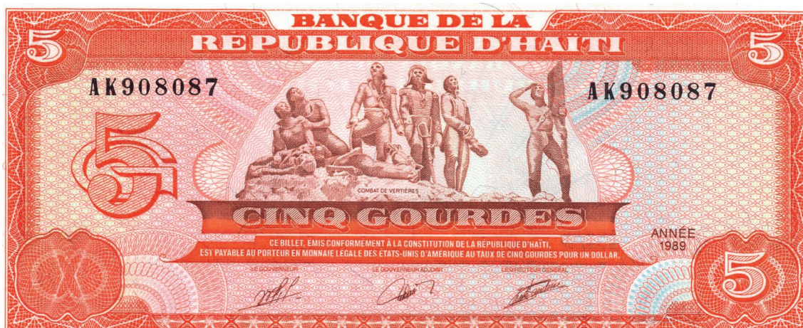
Abbildung 5: 5-Gourdes-Banknote der haitianischen Nationalbank von 1989, gedruckt von der United States Banknote Company. Der damalige Wechselkurs zum Dollar lag bei 5 Gourdes zu 1 US$ (im März 2023 liegt der offizielle Wechselkurs 30-mal höher, vgl. https://www.brh.ht/politique-monetaire/taux-dinteret/ ). Das Motiv zeigt die Schlacht von Batay Vètyè am Ende des Zweiten Haitianischen Unabhängigkeitskrieges im November 1803.

Frankreich erkannte die Unabhängigkeit Haitis erst an, als sich die Karibikinsel unter ihrem Präsidenten Jean-Pierre Boyer 1825 zu Reparationszahlungen in Höhe von 150 Millionen Goldfrancs bereit erklärte. 33 Das entsprach 2% des französischen, aber 300% des haitianischen Nationaleinkommens. Die Lage war aussichtslos: Frankreich war militärisch überlegen, hatte ein Embargo verhängt und über allem hing die Drohung einer erneuten Besetzung der Insel (vgl. Piketty 2022, 86). 34